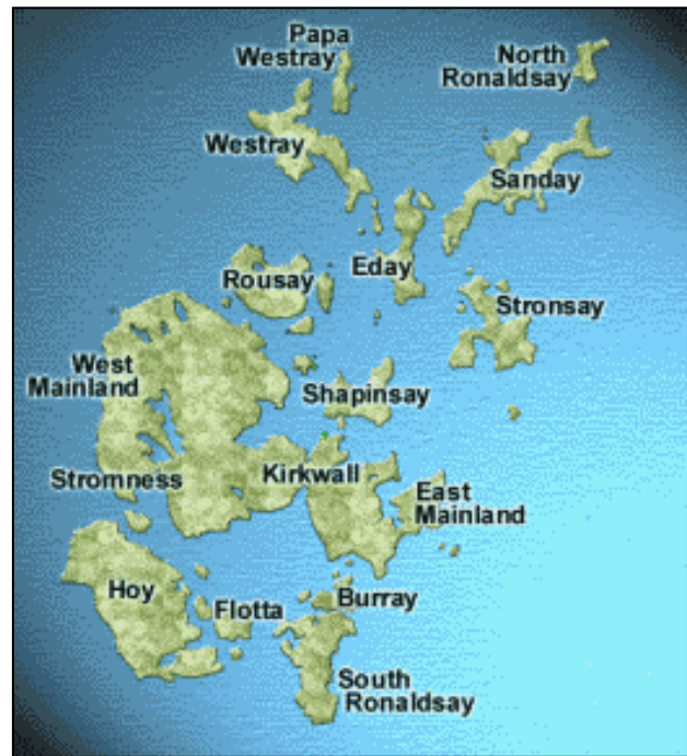
mappa an ynysow

An brassa ynys yw Mainland, ha Kirkwall hy thre chyf. Ynysow erell yw Westray, Sanday, Rousay, Stronsay ha Shapinsay a-gledhbarth a Mainland, ha Hoy ha South Ronaldsay a-dhygowbarth. An ystynnans mor ynter Orkney ha tir meur Alban yw An Caol Arcach (Kulvor an Orkney, po yn Sowsnek 'The Pentland Firth').