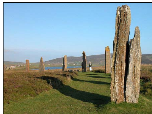
dons meyn Brodgar

Dydhyans-karbon re dhiskwedhas bos knowenn woleskys kevys y'n ranndir ow tos dhe'n blydhynyow 6820 dhe 6660 kyns Krist. Y kevir yn Orkney an tyllerow kynsistorek an gwella gwithys yn Europa oll: Knap Howar, trevesigys a-dro dhe 3500 kyns Krist; Skara Brae, a 3100 kyns Krist; Menhiryon Stennes; an bedh-dremen Maeshowe; an dons meyn Brodgar; ha lies menhir arall. Hendhyskonieth a-dhiwedhes re dhiskudhas komplek-tempel euthyk bras war benntir Brodgar, ha lieskweyth brassa ha lies kansblydhen kyns drehevyans Stonehenge yn Pow Sows.