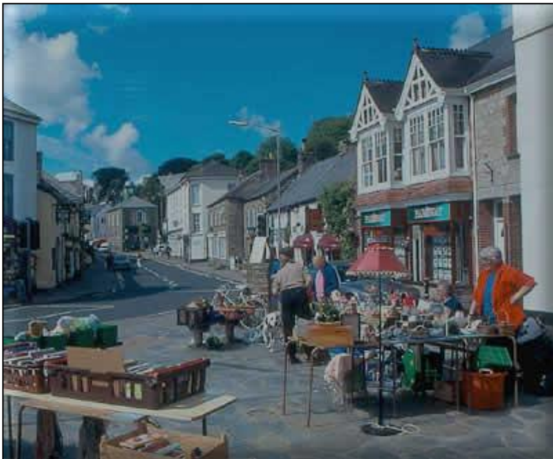
Ryskammel, an dre le may fydh synsys Gorsedh Kernow 2012; gwel gwerthow yn kres an dre.