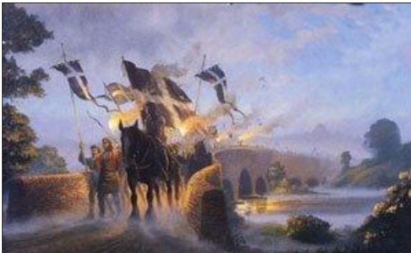
Kernowyon ow tos: delinyans a-dhiworth Keskerdh Kernow war an hyns dhe Loundres 1997, war 500ves kansbloedh an rebellyans a 1497.