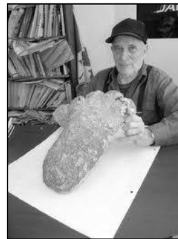
braster ol troes an sasquatch

Lies krambler arall re ros derivas a'n par a-barth an termyn na, pup-prys yn kever Beinn MacDuibh ha'n menydh-yow a-derdro, hag yw an ranndir an moyha garow ha gwyls yn Alban oll. Re anedha a glew kammow kepar dell wrug Collie, re erell a dheskrif omglewans skruth heb rewl ha heb acheson apert, ha niver byghan anedha re dherivas i dhe weles Am Fear Liath Mòr y honan y'n niwl, euthyk bras ha koynt. Yn 1990, tri yonker (ha pub huni anedha divedhow) a welas Am Fear Liath Mòr ow poenya ryb aga harr yn gwylvos ogas dhe Obar Dheathain (Aberdeen), hag i ow lewya neb 40 mildir y'n our. I a ros derivas dhe'n kreslu, mes ny wrug an withysikres krysi dhedha.