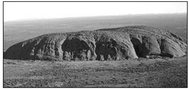
An Garrek Uluru

Yn trist, ni a brenas kartenn-bost a Uluru, an pyth a'gan beus hwath, avel kovadh 'Fatell Ny Dhrehedhsyn Ni Nevra Uluru.