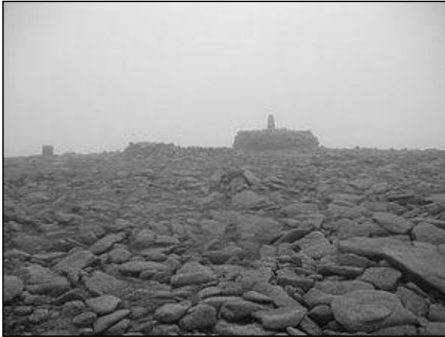
Penn Beinn MacDuibh

byw ha gwir. Re beu hwedhlow yn kever kroaduryon a'n par omma yn Alban nans yw an 13ves kansblydhen, ytho mars yw fantasi, nyns yw fantasi nowydh.