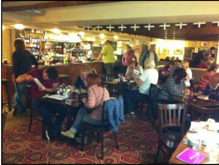
A-ugh: Kernow Kwiz, Lanneves