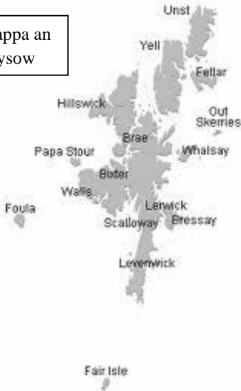
Mappa an ynysow

Devedhyans an hanow yw kepar ha Caithness, henn yw Tus an Gath (Caittland, Hetland, Hyetland, Zetland ha wostiwedh Shetland). Lavar koth an ynysow yw Með lögum skal land byggja (Gans an lagha y hwra tevi an vro). Hwetek ynys a'n kans ynys yw annedhys, mes an unn dre yw Lerwick.