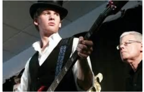
bagasow ilow ha donsya, Lowender Pyran

Pella derivadow a-dhiworth: www.lowenderperan.co.uk po a'n soedhva ☎ 01872 553413 rag tokynyow ha derivadow an dowlenn.