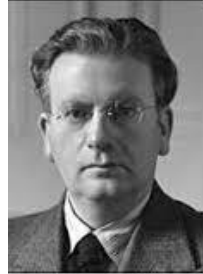
John Logie Baird, dismygyer an bellwolok

Skant ny yllir tybi a vwynans heb pellwolok y'n dydhyow ma. Dhe bup sorn an bys, yma pellwologow. Dismygyer an deknegieth ma, hag a janjyas an bys yn tien, o Alban henwys John Logie Baird (1888-1946).