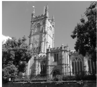
Eglos an Bluw

Nowydh dyllys rag Gorsedh Kernow yw lyver henwyn ranndir an Orsedh. Meur dhe les yw hemma dhymm drefenn ow mamm hag ow thas dhe vos genys y’n dre na hag oll ow herens-wynn trigys ena, kenderwi, ewntres, modrebeth ha’m teylu oll yn hwir – yn Sen Ostell (dell yw lytherennys yn Kernewek Kemmyn).