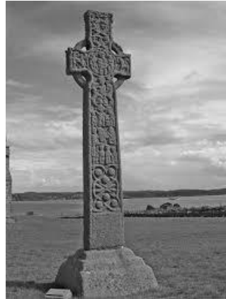
krows keltek war an ynys