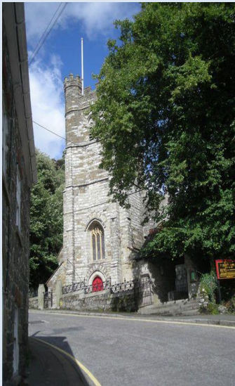
Derivas gans Esmé Tackley (folenn 3)