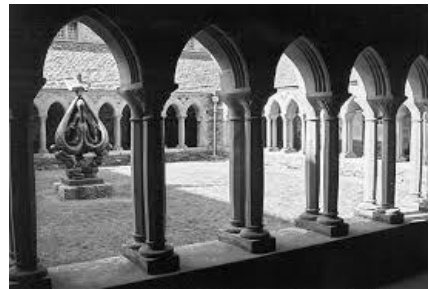
a-ji dhe gloyster an managhti