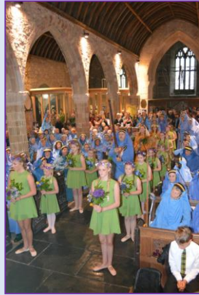
Donsoryon yn Eglws Lannaghevan